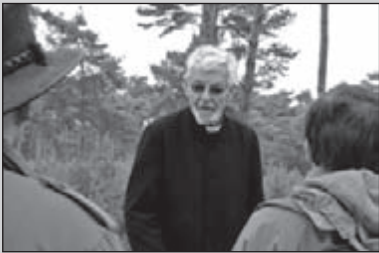
Een gezegende tocht