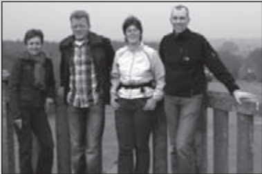
Op zoek naar sponsors