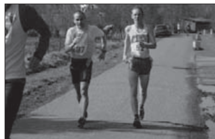
Er waren in maart veel punten te halen bij OLAT-evenementen, zoals hier in Olland.